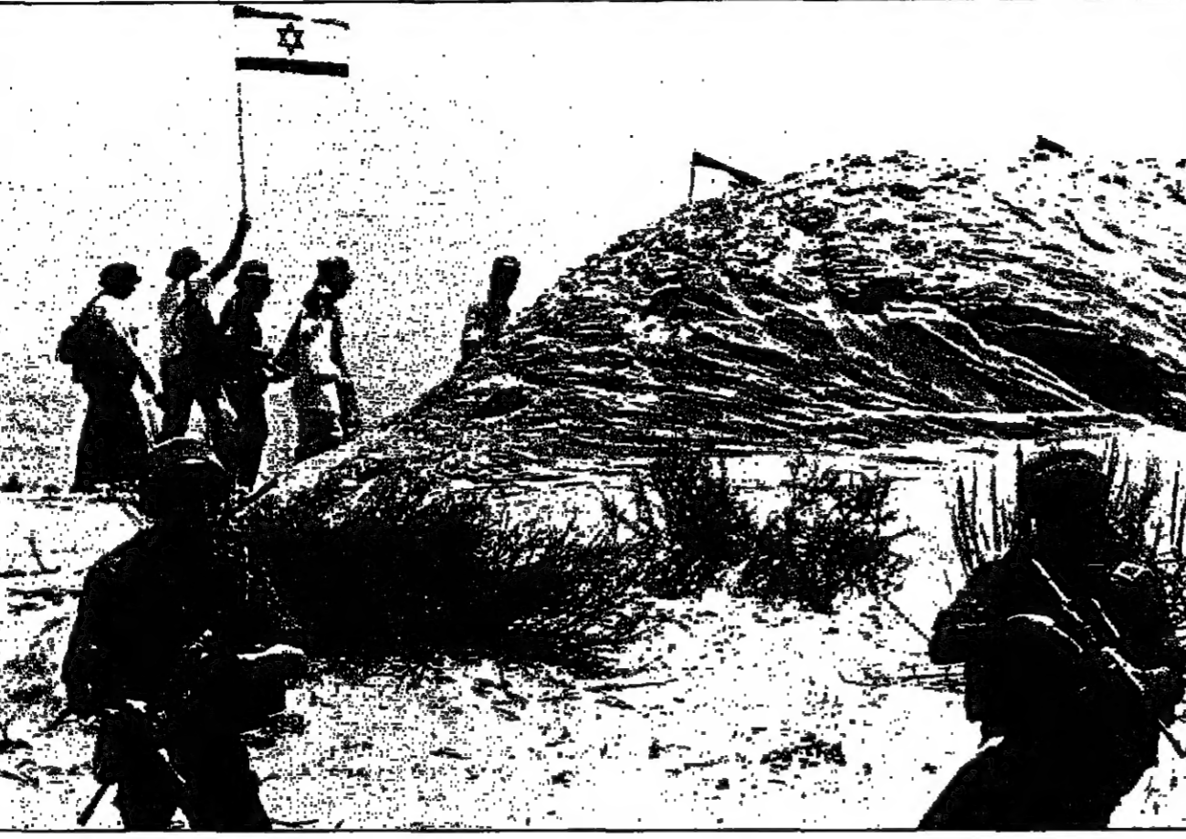
جنود اسرائيليين يجرسون مستوطنين يهودا ويرغمون علم اسرائيل الجمعة على ارض عربية استولوا عليها في قطاع غزة